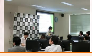
課題の取組み方発表