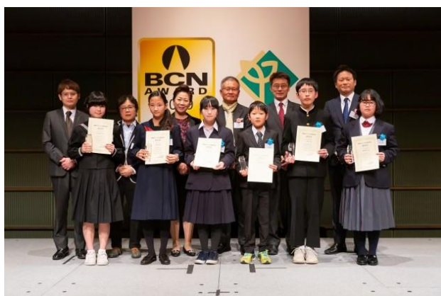
BCN ITジュニアU-16賞 受賞者