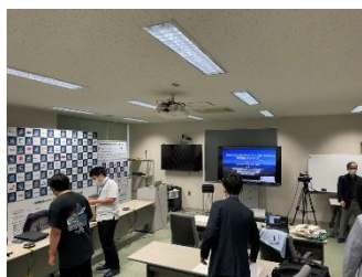
専門講座会場の様子

エムオーテックス(株)/ (株)大塚商会/ (株)オービックビジネスコンサルタント/ (株)シー・シー・ダブル/ シスコシステムズ(同)/ SB C&S(株)/ Dynabook(株)/ ダイワボウ情報システム(株)/ トレンドマイクロ(株)/ 日興通信(株)/ 日本事務器(株)/ 日本電気(株)/ (株)日本HP/ (株)バッファロー/ ピー・シー・イー(株)/ (株)フォーラムエイト/ 富士通(株)/ 富士テレコム(株)