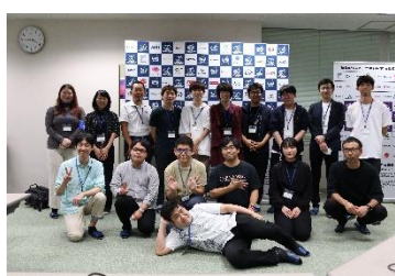
専門講座スタッフ一同