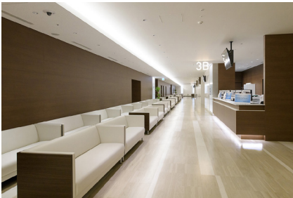
最先端の ICT で守られた慶應義塾大学病院

るセキュリティ対策強化も必要で、特に医療機関を狙ったランサムウェアによるサイバー攻撃が増加傾向にある中、入口となりえる職員の端末への対策は必須といえる状況だったのだ。「コロナ禍を受けて使用頻度が高くなる在宅勤務用貸出 PC をはじめ、HIS に接続可能な端末を対象に、生産性の維持や業務効率化はそのままにセキュリティ対策だけを強化する。これを可能とするソリューションとして、SCE が最適だと考えました」と沼田氏は HP のセキュリティソリューションを推薦した理由を語る。ブロードから話を聞いた HP も行動を開始。さっそく SCE が最大限に活用可能なシーンを想定し、PoC (Proof of Concept : 概念実証) を実施することになった。「SCE はユーザーや管理者に負担をかけず、脅威が含まれる可能性のあるファイルをあらかじめ分離した状態で閲覧できるソリューションです。最大の特長は悪意あるファイルを開いてしまっても、ファイルをクローズさせれば何の影響も受けずに済むことです。さらに、操作中に悪意のある動作の情報を収集し、HP の持つ脅威インテリジェンスを用いて分析することができるので、侵入経路の特定や再発防止に役立てられるので情報システム部のセキュリティ担当にとっても役に立つ情報が取り出せます」と HP 大津山氏は解説する。PoC はスケジュール通り進んでいったが、すべてが順調だったわけではなかった。「セキュリティを強化するうえで、これまで利用していた環境と操作性が変わる点があることや、若干のパフォーマンスダウンが生じることがわかりま