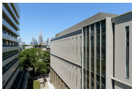
2018年に竣工した新病院棟（1号館）