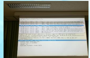
パケット解析の実演