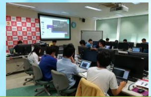
担当講師より講演