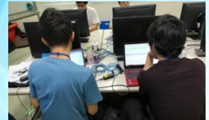
チームで協力して実習