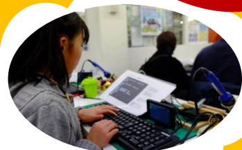
プログラミング中!