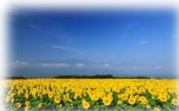
明野のひまわり畑