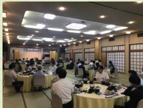
地域交流会 富士レークホテル