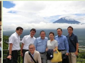
富士山パノラマ ロープウェイ