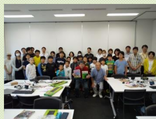
親子みんなで一緒に工作