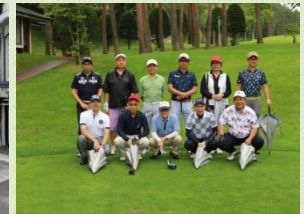
ぐーももチャレンジ カップ 鳴沢ゴルフ倶楽部