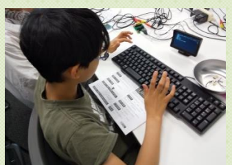
プログラミン体験