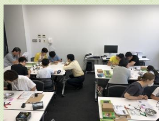
難しい所を先生に相談